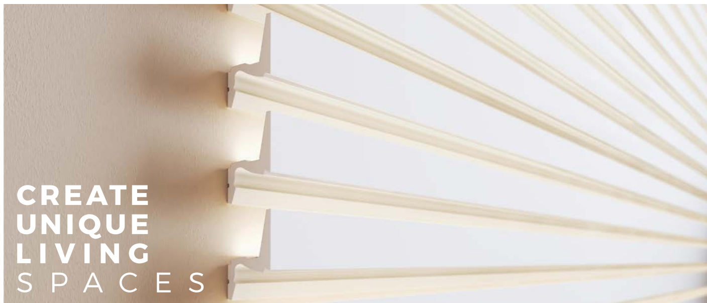
IL7 (ARSTYL®) à effet de mémoire

Les moulures à effet de mémoire, intégrant des moulures déjà existantes dans de nouveaux modèles, permettent de créer des effets très intéressants dans de nombreux espaces intérieurs, en donnant un air de légèreté à une ambiance classique ou en conférant une touche traditionnelle à un intérieur minimaliste.