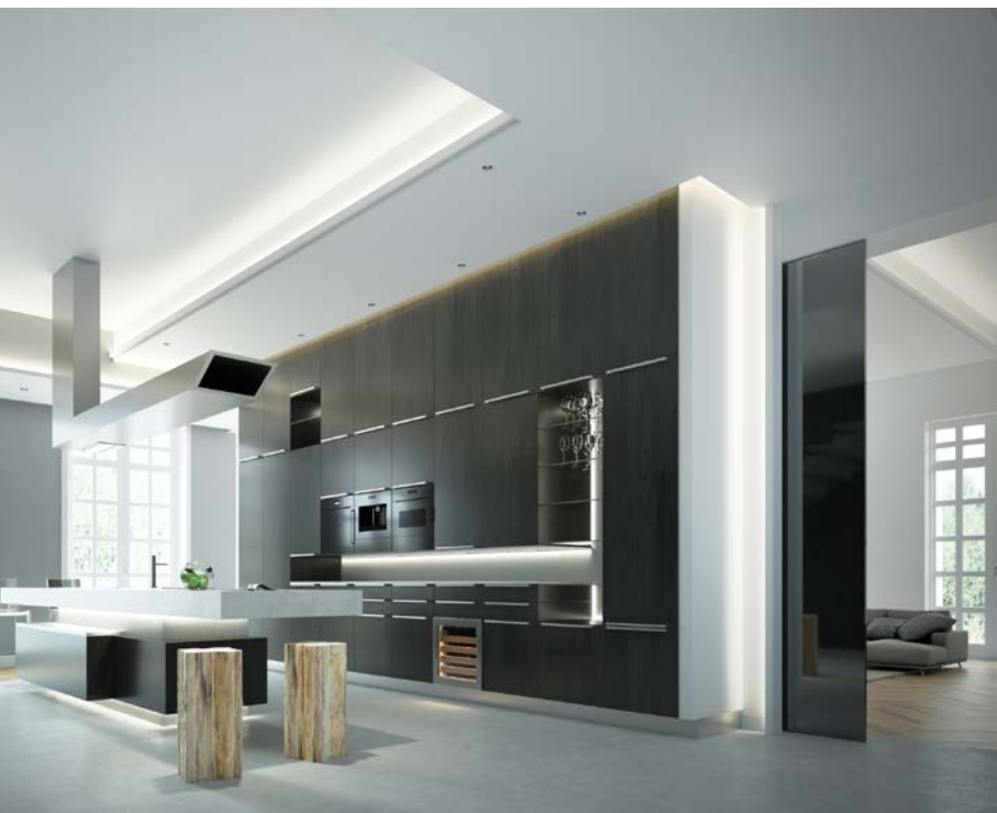
Concept: © Michael Bihain

Epurées, rectilignes et parfaitement proportionnées, les nouvelles moulures du designer belge Michaël Bihain comportent une fine rainure au dos qui permet de les équiper aussi de bandes LED et donc de les utiliser également pour des solutions d'éclairage indirect.